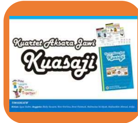
Kartu Kuartet Kuasaji