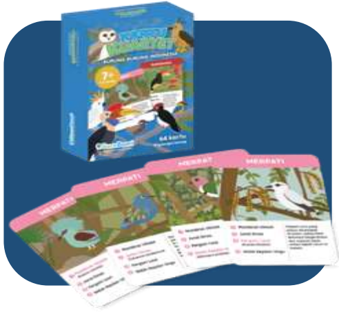
Kartu Kuartet Guru Bumi